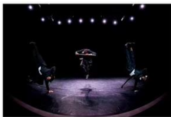
La compagnie Black S.